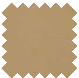
Bois de santal