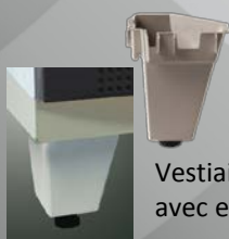
Vestiaires disponibles avec et sans pied