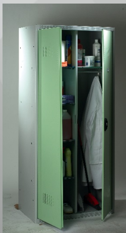
(Visuels non contractuels)