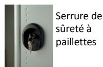
Serrure de sûreté à paillettes