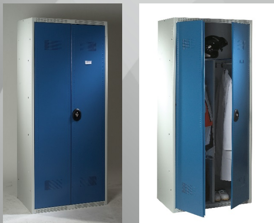
(Visuels non contractuels)