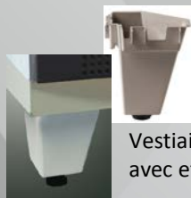
Vestiaires disponibles avec et sans pied

Le procédé de profilage agrafage Seamline® renforce la résistance des montants, équivalent à une tôle ép. 10/10 ème pliée.