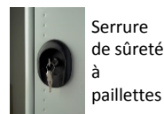
Serrure de sûreté à paillettes