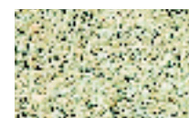
Lavée grains fins. Plusieurs coloris au choix. Sur devis.