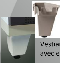
Vestiaires disponibles avec et sans pied