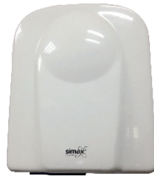
Ref. 01055 Finish: White Finition: Blanc Power: 1.650 W Puissance: 1.650 W